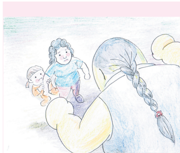
1. 我是『大男人』，问你怕不怕？

答：你的处境我们了解，只是『大男人』不容易被打跨，请留意下期作者「声音」的文章，你将会学到「以柔制刚」的秘密招数。如有时间，盼你能致电与我们详谈。