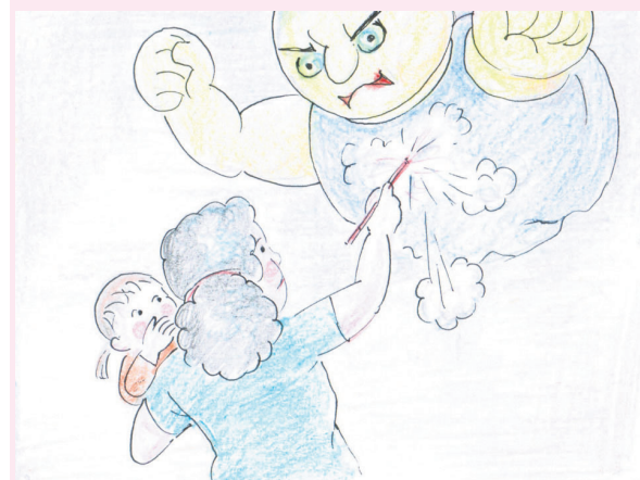
2. 哎唷，『大男人』不应该是很有勇敢的吗？他那儿去了？